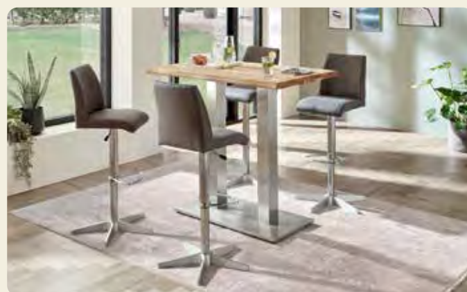
Barhocker mit Liftfunktion, Sitzschale Microfaser-Bezug Onyx, Gestellausführung Edelstahl B/H/T ca. 39/111/55 cm.

Hochlehner mit Stoff-Bezug Slate, Vierfuß-Gestell Edelstahl Kantrohr, B/H/T ca. 56/98/62 cm