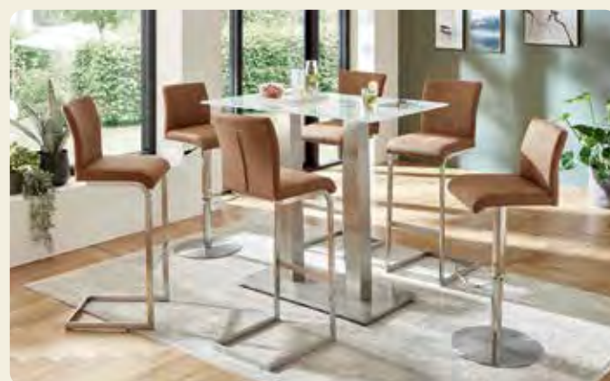
Barhocker mit Liftfunktion, Sitzschale Microfaser-Bezug Amber, Gestellausführung Edelstahl B/H/T ca. 39/111/47 cm. Barhocker mit Schwinggestell, Sitzschale Microfaser-Bezug Amber, Gestellausführung Edelstahl, B/H/T ca. 41/111/50 cm.