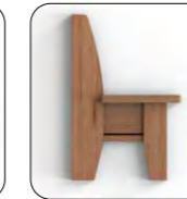
Wange H Wange offen, mit Lisene