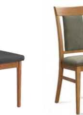
Stuhl Belvano 400 Schaumstoffpolsterung