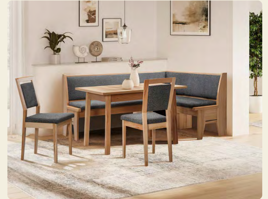
Eckbank B/H/T 185/ 88/145cm, Stuhl B/H/T 53/93/46 cm, Vierfüßtisch mit Klappeneinlage (50 cm) B/H/T 120/74/80 cm, Ausführungen: Bank und Stühle: Bezug Sigma 23 grau, Tisch: Platte furniert 25 mm, Gestell Holzfüße, Holzart: Kernbuche Samtlack