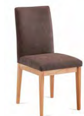
Stuhl Belvano 100 Schaumstoffpolsterung