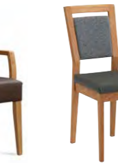
Stuhl Belvano 300 Schaumstoffpolsterung