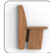
Wange B Wange mit Einsatz schwarz