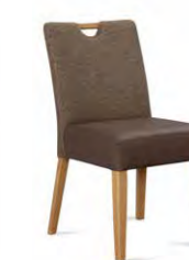
Stuhl Belvano 200 Microtaschenfederkern