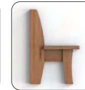
Wange G Wange offen