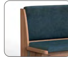
Lehne G (Übersteppung, ohne Absteppung)