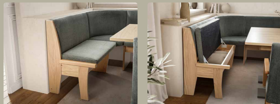
Die wahlweise integrierte Truhenfunktion der Sitzbank schafft praktischen Stauraum für alles, was man griffbereit haben möchte.