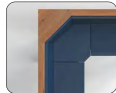
Trapezecke gegen Aufpreis