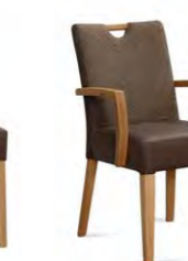
Stuhl Belvano 200A Microtaschenfederkern