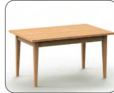
Vierfüßtisch Mod. Belvano 100 ohne Auszug, Platte furniert, Zarge massiv, gegen Aufpreis mit Auszug Größenraster Längenraster 110 bis 200 cm Breitenraster 70 bis 110 cm