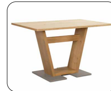
Säulentisch Mod. Belvano 500 ohne Auszug, Platte furniert, Sockelplatte Edelstahloptik oder schwarz, gegen Aufpreis mit Auszug Größenraster Längenraster 110 bis 180 cm Breitenraster 70 bis 110 cm