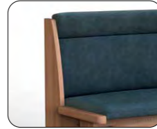
Lehne C (Übersteppung, mit Absteppung)