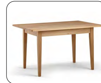
Vierfüßtisch Mod. Belvano 200 ohne Auszug, Platte massiv, Zarge massiv, gegen Aufpreis mit Auszug Größenraster Längenraster 110 bis 200 cm Breitenraster 70 bis 110 cm