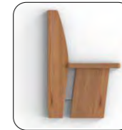
Wange C Wange mit Einsatz edelstahlfärbig