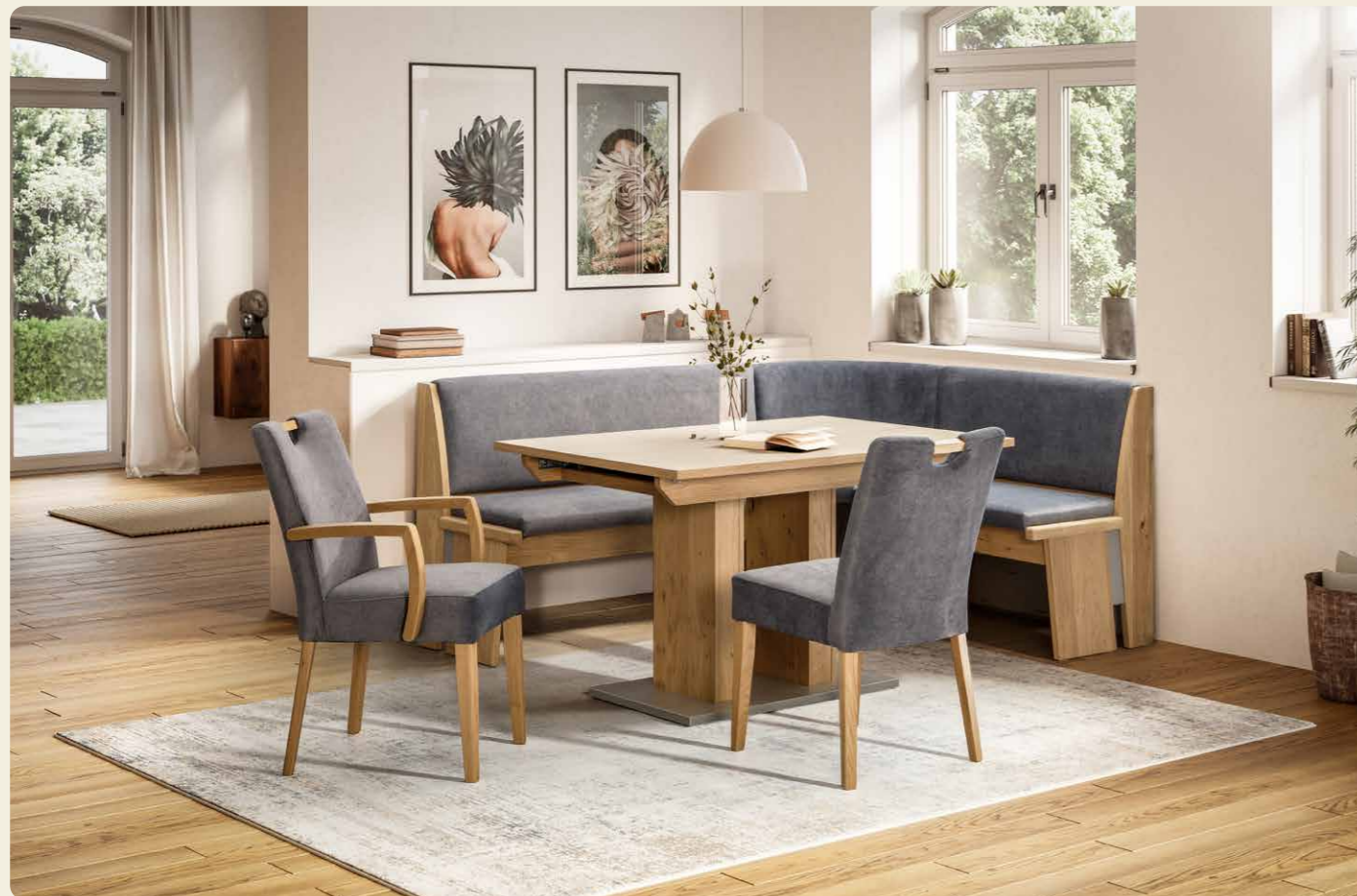
Eckbank B/H/T 195/88/155cm, Armlehnstuhl B/H/T 53/90/61cm, Stuhl B/H/T 48/90/61cm, 2-Säulentisch mit Schiebeplattenfunktion (50 cm) B/H/T 130(180)/76/90 cm, Ausführungen: Bank und Stühle: Bezug Cara 5607 mittelgrau, Tisch: Platte furniert, Bodenplatte Edelstahloptik, Holzart: Wildeiche Samtlack