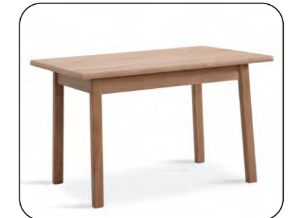
Vierfüßtisch Mod. Belvano 300 ohne Auszug, Platte furniert, Zarge furniert, gegen Aufpreis mit Auszug Größenraster Längenraster 110 bis 160 cm Breitenraster 70 bis 110 cm