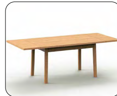
Vierfüßtisch Mod. Belvano 400 mit altdeutschem Auszug, Platte furniert, Zarge furniert Größenraster Längenraster 110 bis 160 cm Breitenraster 70 bis 110 cm