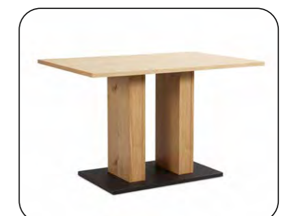
2-Säulentisch Mod. Belvano 600 ohne Auszug, Platte furniert, Säule senkrecht furniert, Sockelplatte Edelstahloptik oder schwarz, gegen Aufpreis mit Auszug Größenraster Längenraster 110 bis 220 cm Breitenraster 70 bis 110 cm