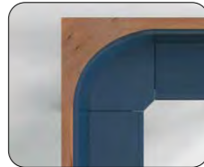
Rundecke gegen Aufpreis und nur bei Lehne B, G und H möglich