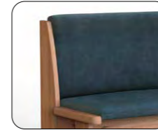
Lehne H (Übersteppung, ohne Absteppung)