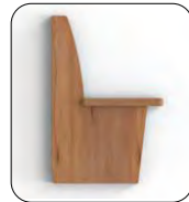
Wange A Wange geschlossen