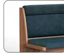
Lehne D (Übersteppung, mit Absteppung)