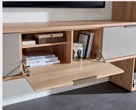
Nach unten klappbar: Cleverer Stauraum, stilvoll gelöst