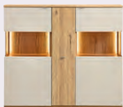
Highboardkombi, 2-trg. mit 1 Auszug, Korpus und Frontabs. Risseiche, Front Sand- beige

Elementauswahl Beispiele von Farb- und Kombinationsvarianten, Deckblatt in Balkenbuche oder Risseiche, Vitrinen-Rückwand in Balkenbuche oder Risseiche geschroppt (optional gegen Aufpreis wählbar). Die gesamte Planungsvielfalt entnehmen Sie bitte unserem Typenplan.