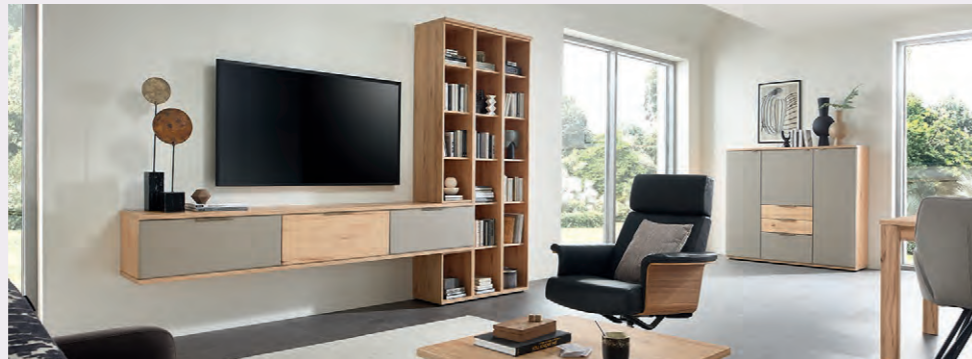
Offene Wohnkonzepte mit harmonischem Übergang

Im Essbereich zeigt vito BERGHE seine elegante, wohnliche Seite. Sideboards, Highboards und Vitrinen schaffen Stauraum und setzen zugleich stilvolle Akzente. Graues ESG-Glas in Vitrinentüren und Glasböden verleiht dem Programm eine moderne Leichtigkeit, während Holzdekore für Wärme sorgen.