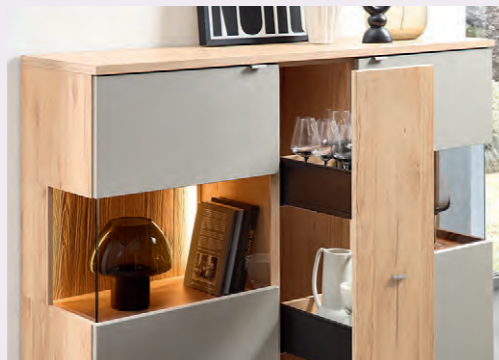
Reduziertes Design, das Raum für persönliche Akzente lässt