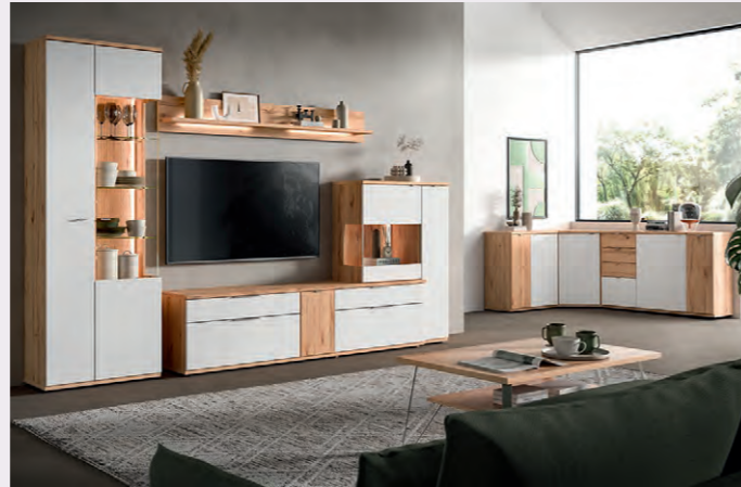
Moderne Wohnlösungen mit klarer Struktur und Leichtigkeit