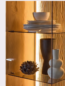
Vitrinen mit grauem ESG-Glas für moderne Akzente

Durch die offene Gestaltung lassen sich Wohn- und Essbereiche harmonisch miteinander verbinden. Optional integrierte Beleuchtung unterstreicht die hochwertige Verarbeitung und sorgt für eine angenehme Atmosphäre – ideal für gesellige Abende und stilvolles Wohnen.