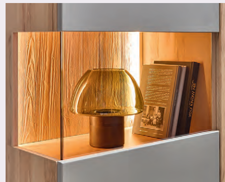
Harmonische Materialkombinationen mit natürlicher Ausstrahlung