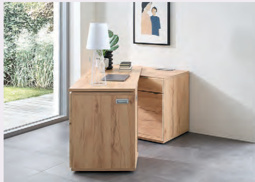
Je nach Bedarf: Die Schreibplatte lässt sich nach rechts oder links ausdrehen