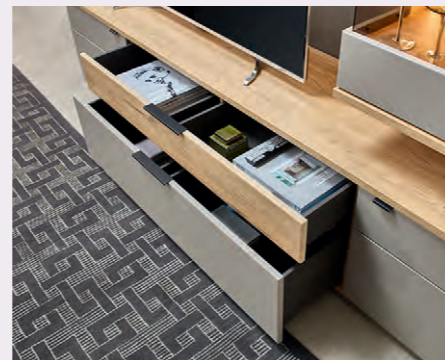
Feine Details und hochwertige Verarbeitung bis ins kleinste Element