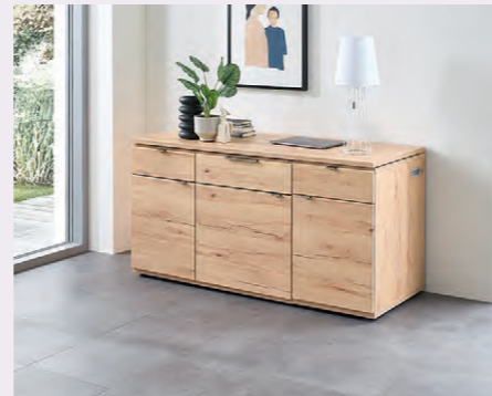
Variabel wählbar: Das Office-Element ist in 150 cm oder 180 cm Breite erhältlich