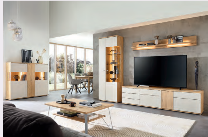
Klare Linien und ruhige Flächen für zeitlose Wohnkonzepte

bestehend aus: 1 x Vitrine mit 2 Türen 1 x Lowboardkombi mit 3 Schüben und 3 Türen 1 x Wandbord