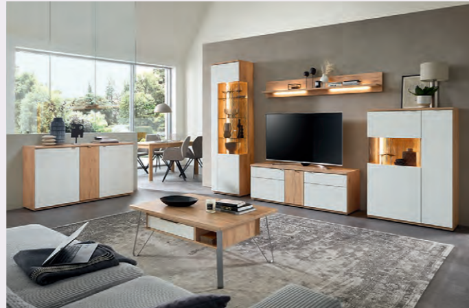
Stimmungsvolle Beleuchtung für besondere Momente