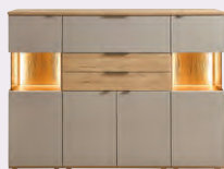
Highboardkombi, 4-trg. mit 2 Schübe und 1 Klappe, Korpus und Frontabs. Risseiche, Front Grau matt