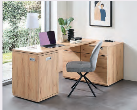
Sideboards mit integrierter Schreibplatte – Arbeiten neu gedacht