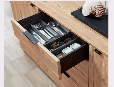
Elegante Speisezimmerlösungen mit klarer Linienführung