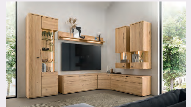
Intelligente Medienlösungen für ein aufgeräumtes Wohngefühl

Besonders praktisch: Sideboards in zwei Breiten mit drehbarer Schreibplatte lassen sich flexibel als Home-Office-Element nutzen. So entstehen Arbeitsbereiche, die sich harmonisch in den Wohnraum integrieren – funktional, unaufdringlich und stilvoll zugleich.