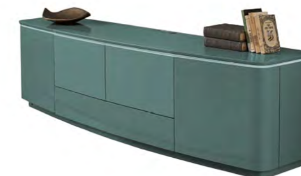
Lack hochglänzend Ocean LC34 mit Lack matt Ocean LM34