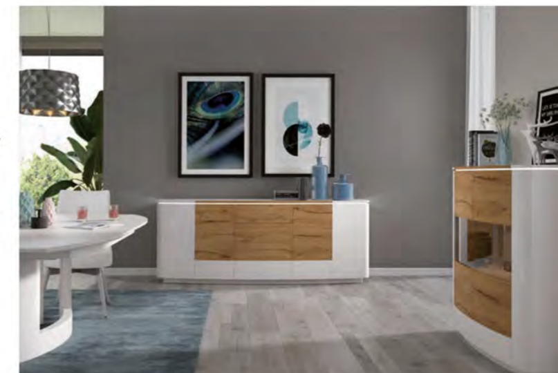
D-SIGN DANTARO: Individuelle Solotypen in Lack hochglänzend weiß LC02 mit wohnlichen Holzakzenten in Front- und Deckblatt in Asteiche Furnier.