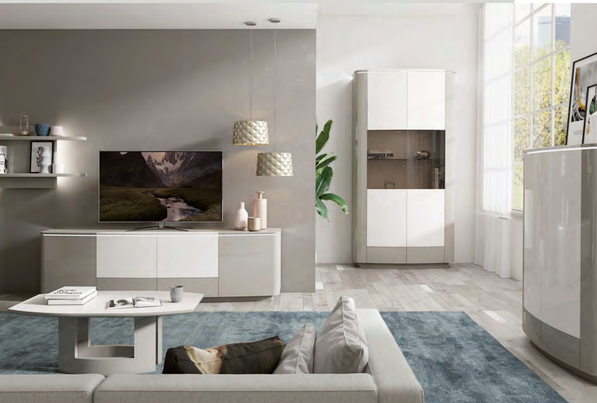
Harmonische Kombination in Lack hochglänzend silber LC23 mit Akzenten in Lack hochglänzend wollweiß LC29.