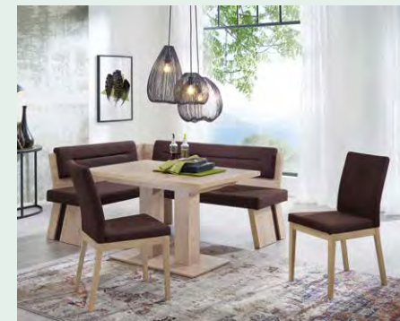
Eckbankgruppe mit Wange A und Lehne 1.