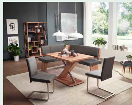
Eckbankgruppe mit Wange D und Lehne 2.