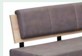
Lehnenvariante 3 offen, mit Senkrech- steppung, Bügel schwarz