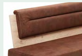
Lehnenvariante 1 geschlossen, mit Quersteppung

*Wange A wird bei dem Bankteil und der Sitzbank aus Stabilitätsgründen gerade gefertigt!