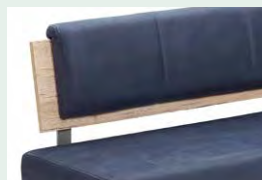
Lehnenvariante 2 offen, mit Senkrech- steppung, Bügel edel- stahlfarbig