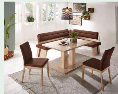
Eckbankgruppe mit Wange A und Lehne 1.