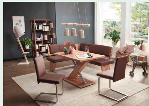
Eckbankgruppe mit Wange D und Lehne 2.