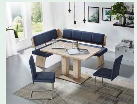
Eckbankgruppe mit Wange B und Lehne 2.