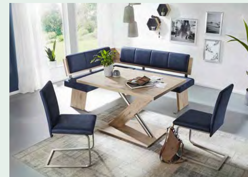
Eckbankgruppe mit Wange B und Lehne 2.