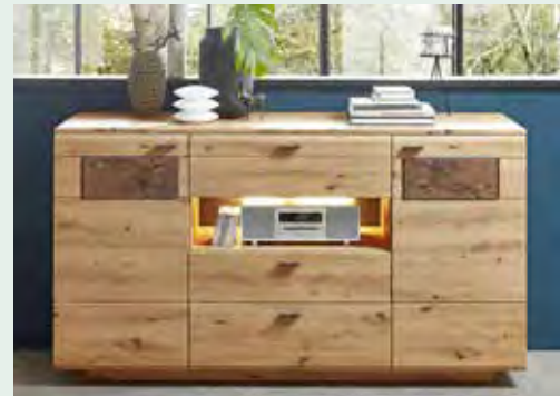
Schmuckes Sideboard – ideal als Solitär fürs Wohnen und Speisen