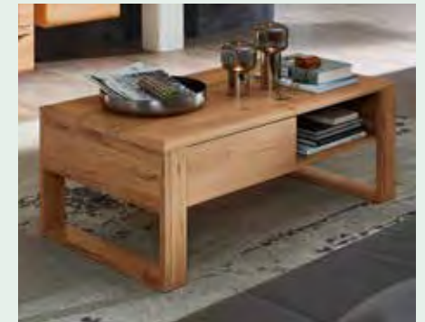
Passender Couchtisch mit Schubkästen und 3 offenen Fächern