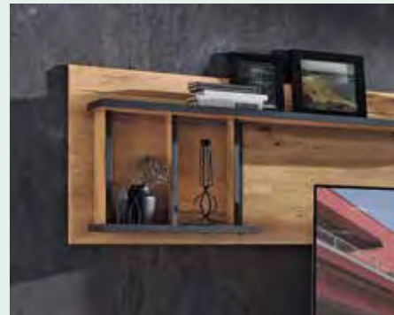
Wandregalböden und Stützseiten mit anthrazitfarbenen Absetzungen