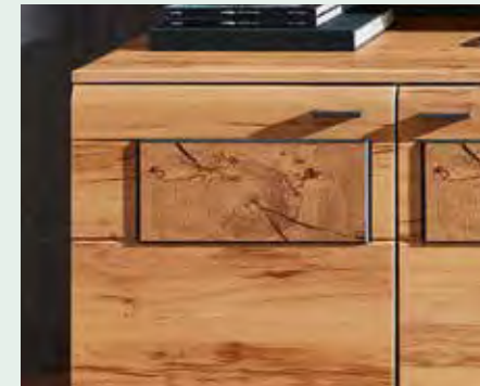
Frontabsetzung Hirnholz Nachbildung bei Frontausführung Kernbuche MDF.