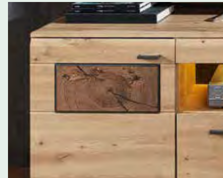
Kontrastabsetzung Hirnholz Nachbildung bei Frontausführung Artisan Eiche MDF