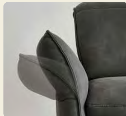
Liegearmlehnen in allen Elementen mit Armlehne möglich; außer im Sessel