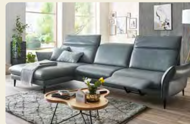
Longchairkombination mit Kopfpolster-/ Armteilverstellung und motorischer Beinauflage, Bezug Leder Vivre steel, Stellmaß 180x337 cm