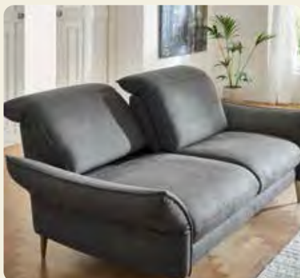
Einzeln verstellbare Kopfpolster mit Rasterfunktion