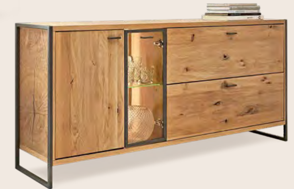
Sideboard mit 1 Holz- und 1 Glastür und 2 Schubkästen, Vitrinenfach mit LED- Beleuchtung B/H/T 185/85/44 cm