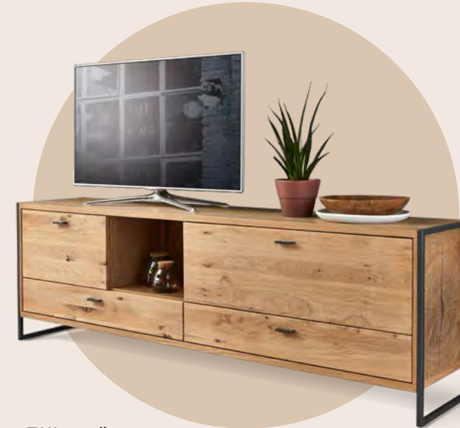
TV-Unterteil mit 2 Klappen, 2 Schubkästen, und 1 offenem Fach B/H/T 215/68/44 cm