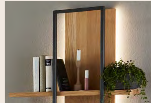
Rahmen und Lichteffekte erzeugen Raffinesse beim Wandbord.