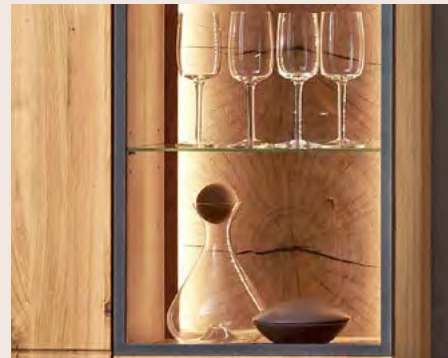
Die sichtbaren Rückwände faszinieren mit Hirnholzoptik.