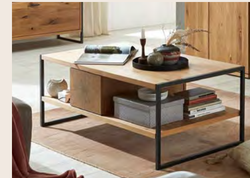
Der Couchtisch passt sich an mit furnierter Platte und Hirnholz-Akzenten.