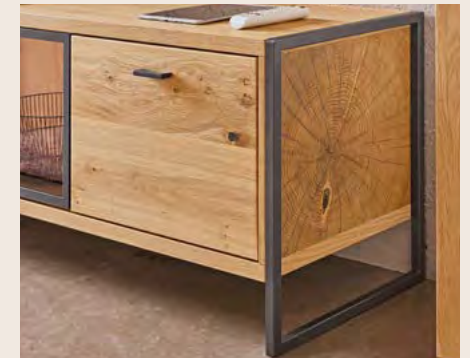
Hirnholzabsetzungen verleihen den Möbeln eine exklusive Optik.