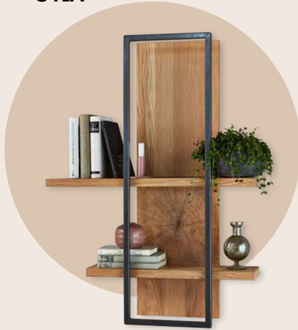
Wandbord mit 2 Ablageböden, indirekte LED-Beleuchtung optional (1x 2er Set 850 mm) B/H/T 75/101/22 cm