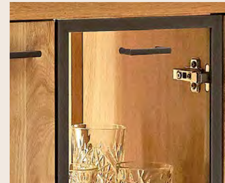
Die Vitrinen sind mit Klarglas und Metallrahmen ausgestattet.