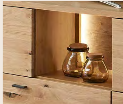
LED sorgt auf Wunsch für stimmungsvolle Beleuchtung.