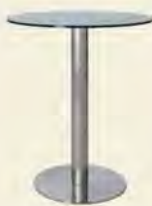
Tresentische, Höhe ca. 92 cm