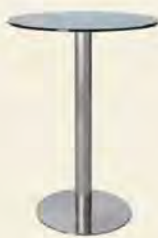
Hochtische, Höhe ca. 105 cm