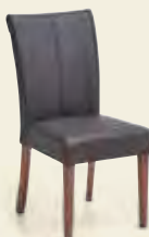
Stuhl, 4-Fußgestell Wild-Nussbaum, Bezug Echtleder Mocca