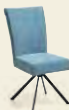
Stuhl, Gestell Stativ Metall schwarz, Bezug 100 % PET- Recycling Eisblau