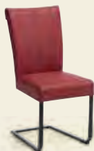
Schwingstuhl, Gestell Flachstahl Eisen schwarz, Bezug Echtleder Rubin

Über 1.500 mögliche Stuhlkombinationen! Die Sitzschalen und Stuhlgestelle sind beliebig kombinierbar.