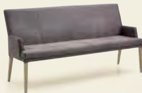
Komfortbank mit Armlehnen, 160/180/200 cm Breite, 4-Fuß Massivholzgestell, Bezug Microfaser anthrazit