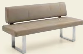
Designbank, 160/180/200/220/240 cm Breite, Kufengestell Edelstahl gebürstet, Bezug Echtleder stone