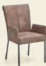
Armlehnstuhl, 4-Fußgestell Rundrohr Eisen schwarz, Bezug Microfaser Schlamm