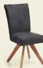
Stuhl, Gestell Stativ Wildeiche massiv, Bezug Microfaser Anthrazit