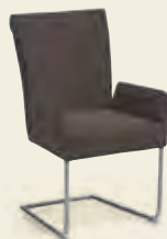
Armlehn- Schwingstuhl, Gestell Rundrohr Edelstahl gebürstet, Bezug 100% PET- Recycling schlamm