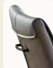
Alle Sitzschalen sind gegen Mehrpreis mit einem Metallgriff lieferbar.