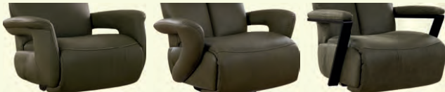
Armteil 1 Armteil 2 Armteil 3* (gegen Aufpreis)