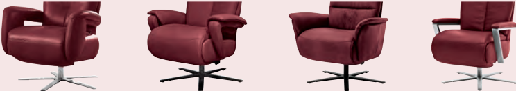
Armteil 1 Armteil 2 Armteil 3 Armteil 4* (gegen Aufpreis)