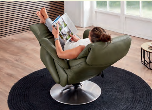
Herz-Waage-Funktion opt. zur Kreislaufentlastung