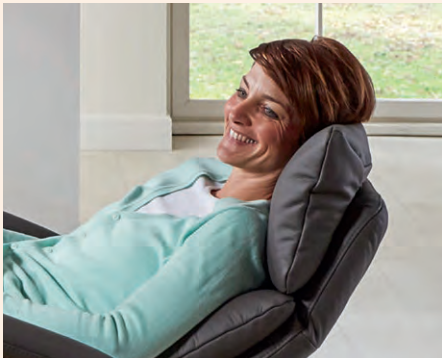
Kopfteilverstellung in der motorischen Ausführung (gegen Aufpreis)