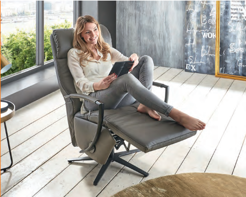
Gönnen Sie sich Ihre tägliche Auszeit: vito VARIETY 2.0 bietet ein Plus an Komfort für Ihre persönliche Entspannung