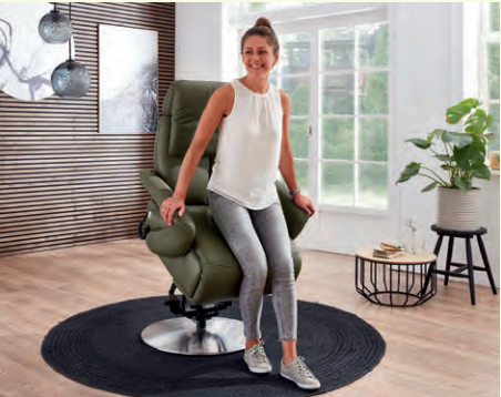
Aufstehhilfe motorisch, max. Belastung 160 kg opt.