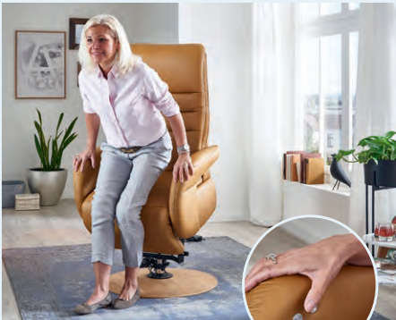
Motorische Aufstiehhilfe mit Berührungssensor (gegen Aufpreis)