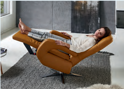
Herz-Waage-Funktion, optional auch mit Aufsteh- hilfe und Akku (gegen Aufpreis)