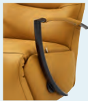
Armteil 4* (gegen Aufpreis)