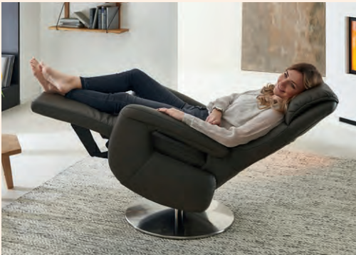
Herz-Waage-Funktion, optional auch mit Aufstehhilfe und Akku (gegen Aufpreis)