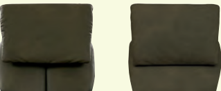
Rücken 1 Rücken 2 (mit höhenverstellbarem Kopfteil)