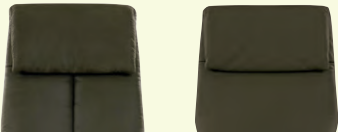
Rücken 1 Rücken 2