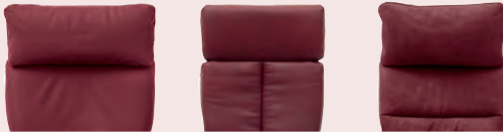
Rücken 1 Rücken 2 Rücken 3