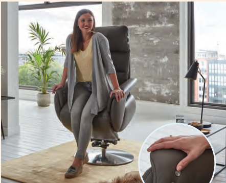
Motorische Aufstehhilfe mit Berührungssensor (gegen Aufpreis)