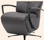
Armteil 3* (gegen Aufpreis)