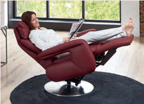
Herz-Waage-Funktion: opt. auch mit Aufstehhilfe/Akku