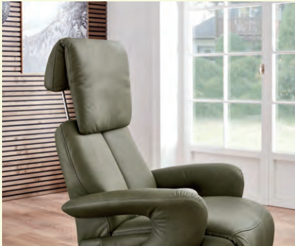
Optional mit höhenverstellbarem Kopfteil